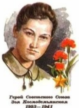
Герой Советского Союза Зоя Космодемьянская 1923—1941

Объявляется Минута молчания. Звучит метроном.